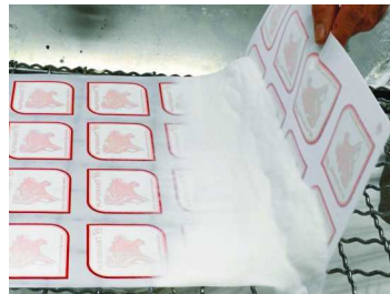
3. Ponga el polvo termofusible en el adhesivo húmedo