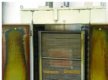
6. Secado del adhesivo según las instrucciones del fabricante