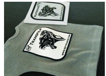
8. ¡Retirar el liner en frío, listo!