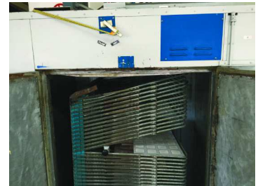
4. Secar el adhesivo a menos de 80 °C