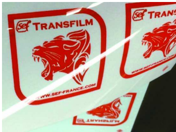
1. Imprime a través del flock y seca

Liner de poliéster flocado con fibras de flock de viscosa de 0,3 mm para la producción de transferencias de flock multicolor. La película de transferencia se caracteriza por una alta densidad de flocado uniforme y una altura de flocado constante. Los diseños pueden transferirse sin que queden fibras de flocado indeseadas en la superficie del tejido.