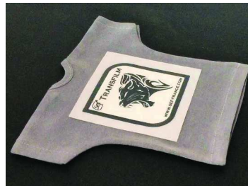
7. Separe y transfiera los motivos según las instrucciones del fabricante del termofusible