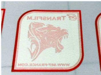
5. Limpie el exceso de polvo de hotmelt